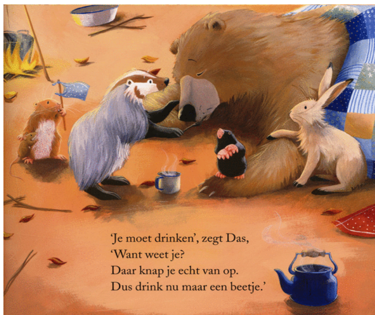
Uit: Karma Wilson & Chapman, Bear is ziek . Veltman Uitgevers B.V., juni 2014