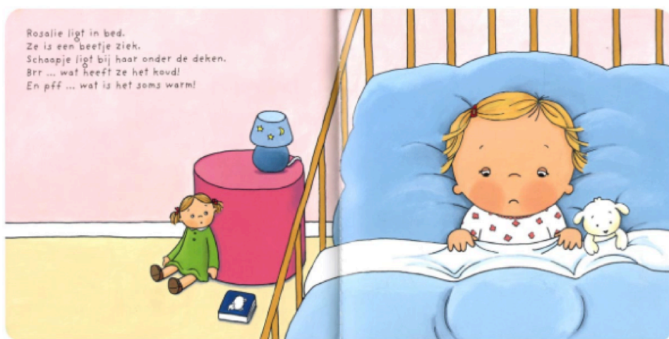
Uit: Linne Bie, Kleine Rosalie is ziek . Uitgeverij Clavis, maart 2007

Kijk naar de bladzijden uit de boekjes. Welk boek vind je kind leuk, denk je?